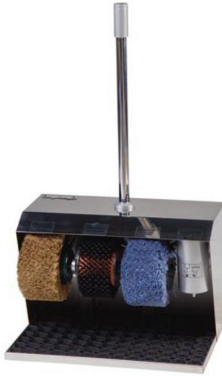
Рисунок А.6 – Royal Chrome