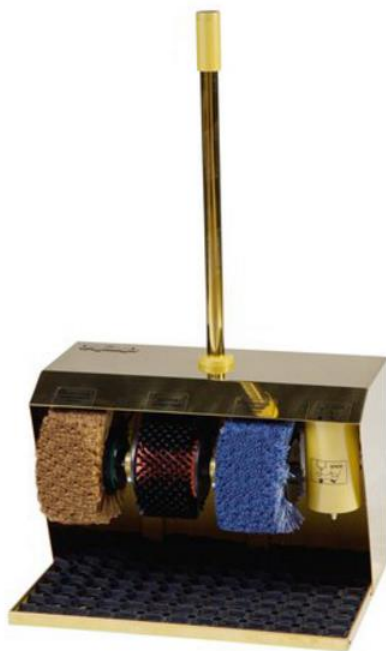
Рисунок А.6 – Royal Gold