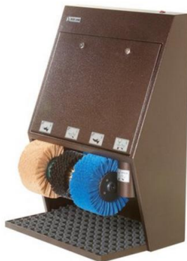
Рисунок А.1 – Эко Люкс 3 Крем