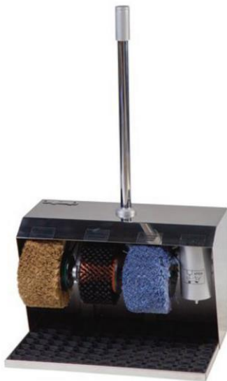
Рисунок А.6 – Royal Chrome