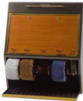
Рисунок А.5 – Royal Lux 4 Dekor