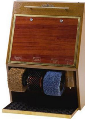
Рисунок А.4 – Royal Lux 3 Dekor