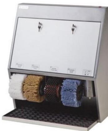
Рисунок А.2 – Эко Люкс 4 Крем