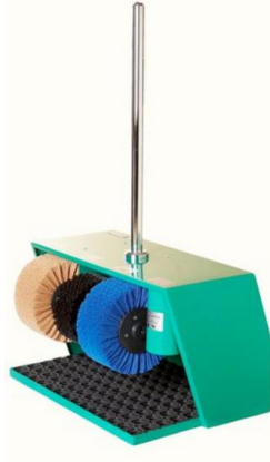
Рисунок А.3 – Эко Классик 3 Крем